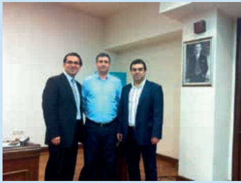
Biyoistatistik Kurs fotoğrafı 1