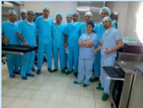
Laparoskopi Kurs fotoğrafı