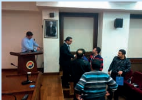
Biyoistatistik Kurs fotoğrafı 2