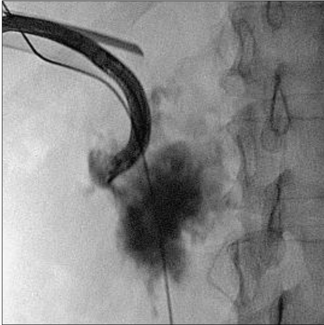
Şekil 2. Kontrast madde ekstravazasyonu ile gösterilen toplayıcı sistem perforasyonu.

Campbell's Urology 10. baskı, 2. cilt, 2012